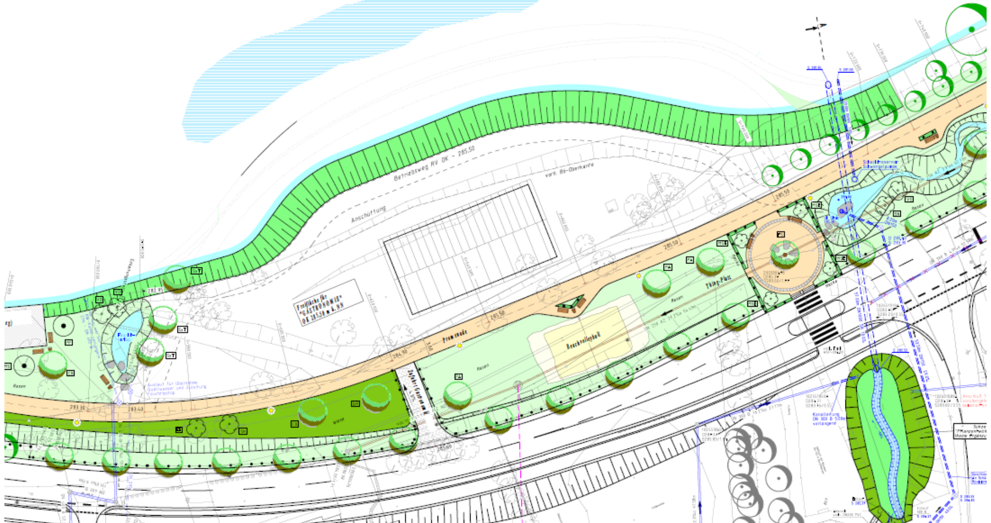
Promenade Amecke