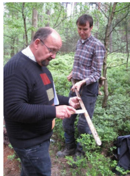
Beurteilung der Bodeneigenschaften durch den Geologischen Dienst NRW

Die Arbeiten sind Teil der forstlichen Standortkartierung, die vom Landesforstgesetz für sämtliche Wälder des Landes vorgeschrieben