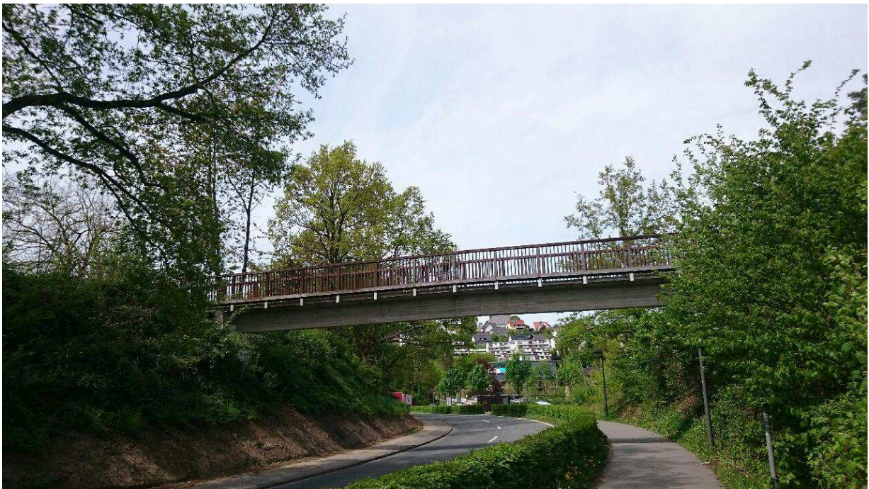
Ansicht der Brücke

Die betroffenen Anlieger, Verkehrsteilnehmer und Urlaubsgäste werden um Verständnis gebeten.